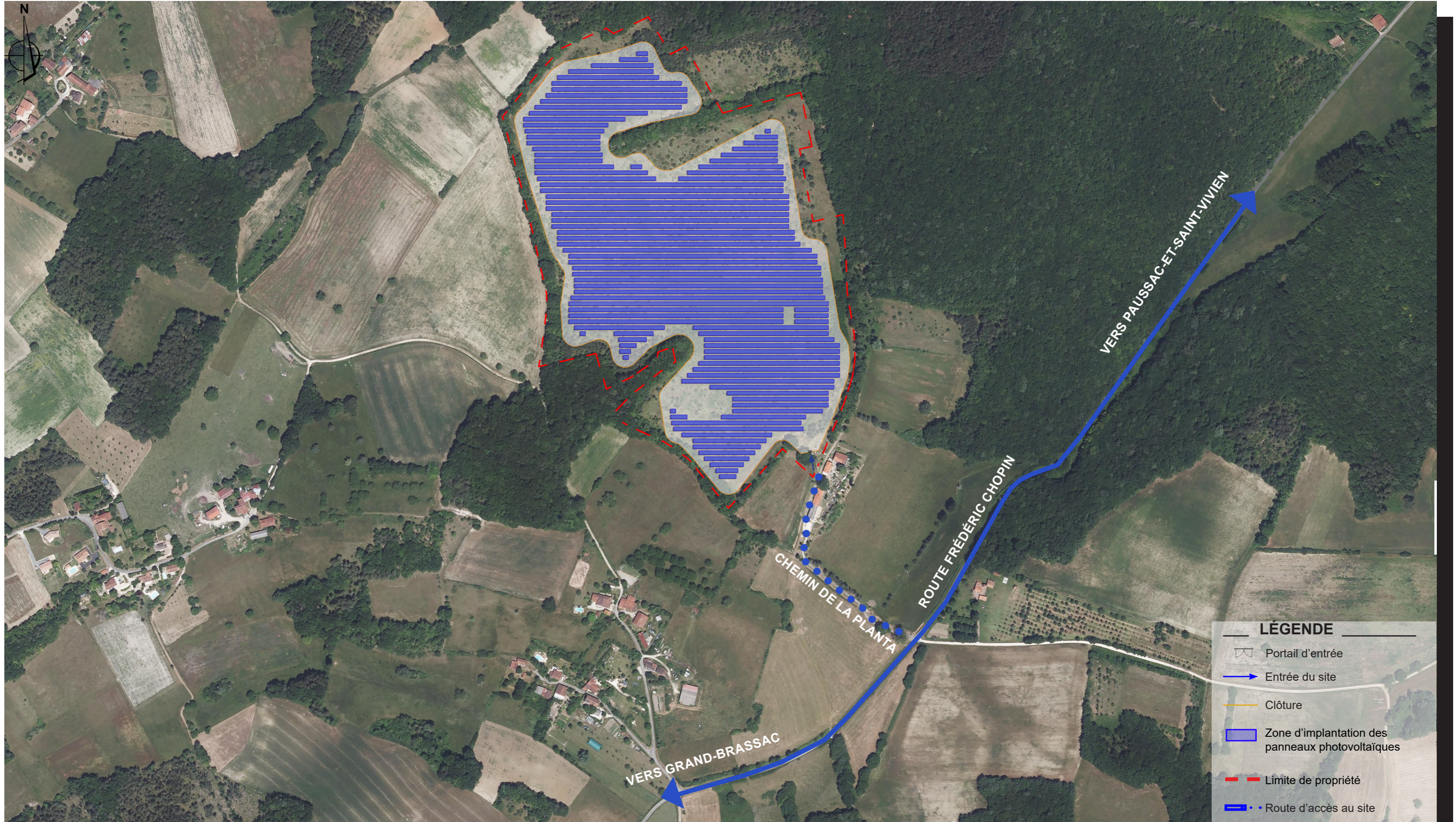
Aérienne - google earth - Echelle : 1/5 000ème